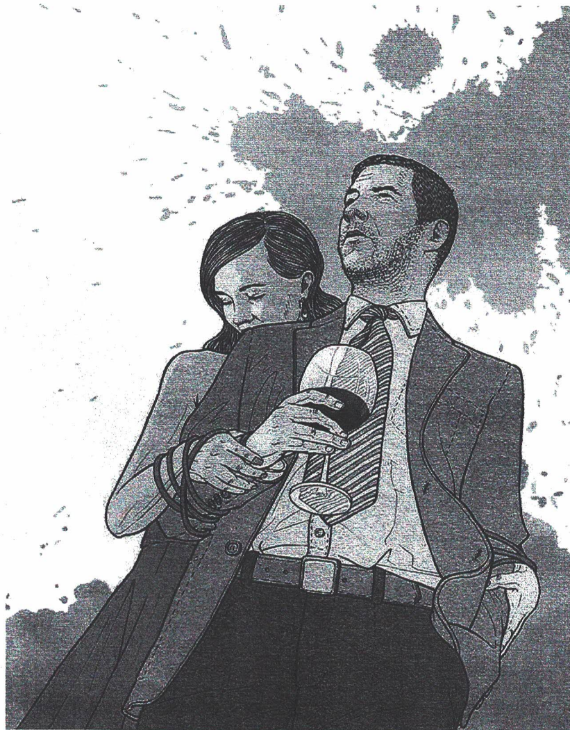
图3-2-1 写实风格情景插画

直观地表现事物，传授知识，使人们从插画中认识事物的形状、色彩、质感和性能（图3-2-1）。这种插画的形象经常是产品本身，产品的某部分，准备使用的产品，使用中的产品，试验对照的产品，产品的区别特征，使用该产品能得到的收益，不使用该产品可能带来的恶果，证词性图例，等等。