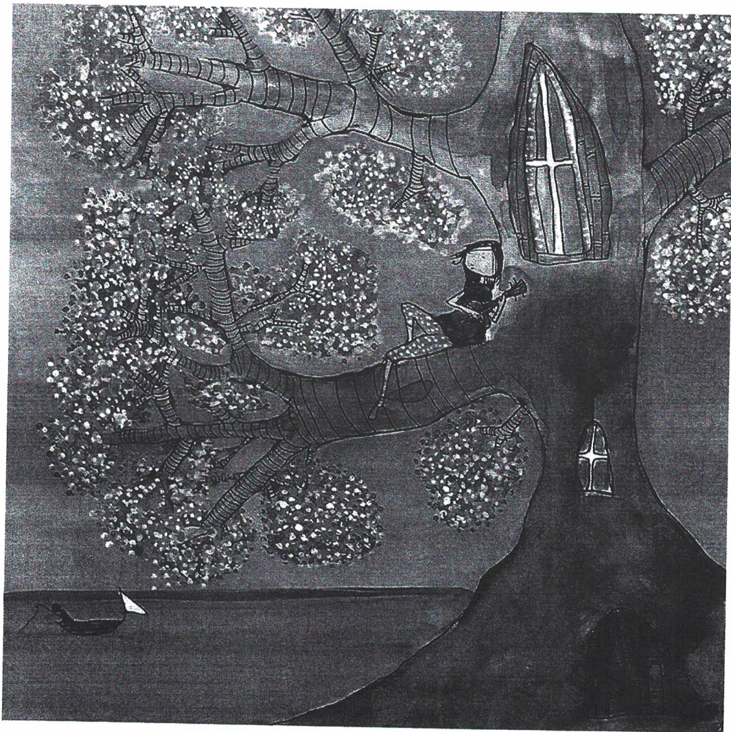
图3-2-2 温馨的情景插画设计

利用插画的形象将语言文字所表达的无形的精神活动具象化。使人们喜怒哀乐的情绪，探索、向往、追求的理想实实在在地表现在观者面前（图 3-2-2）。