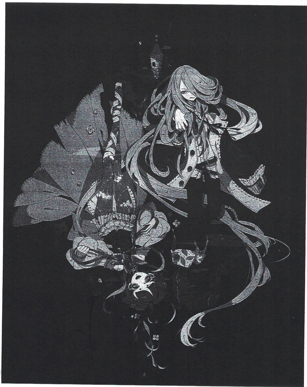
图3-2-4 华丽、浓厚的插画设计风格

插画可以利用画面的色彩、造型等视觉要素构成的艺术效果来强化形象的感染力(图3-2-4)。将情绪注入到作品中,巧妙地结合在插画里,从而以情动人,达到传递情感的目的。